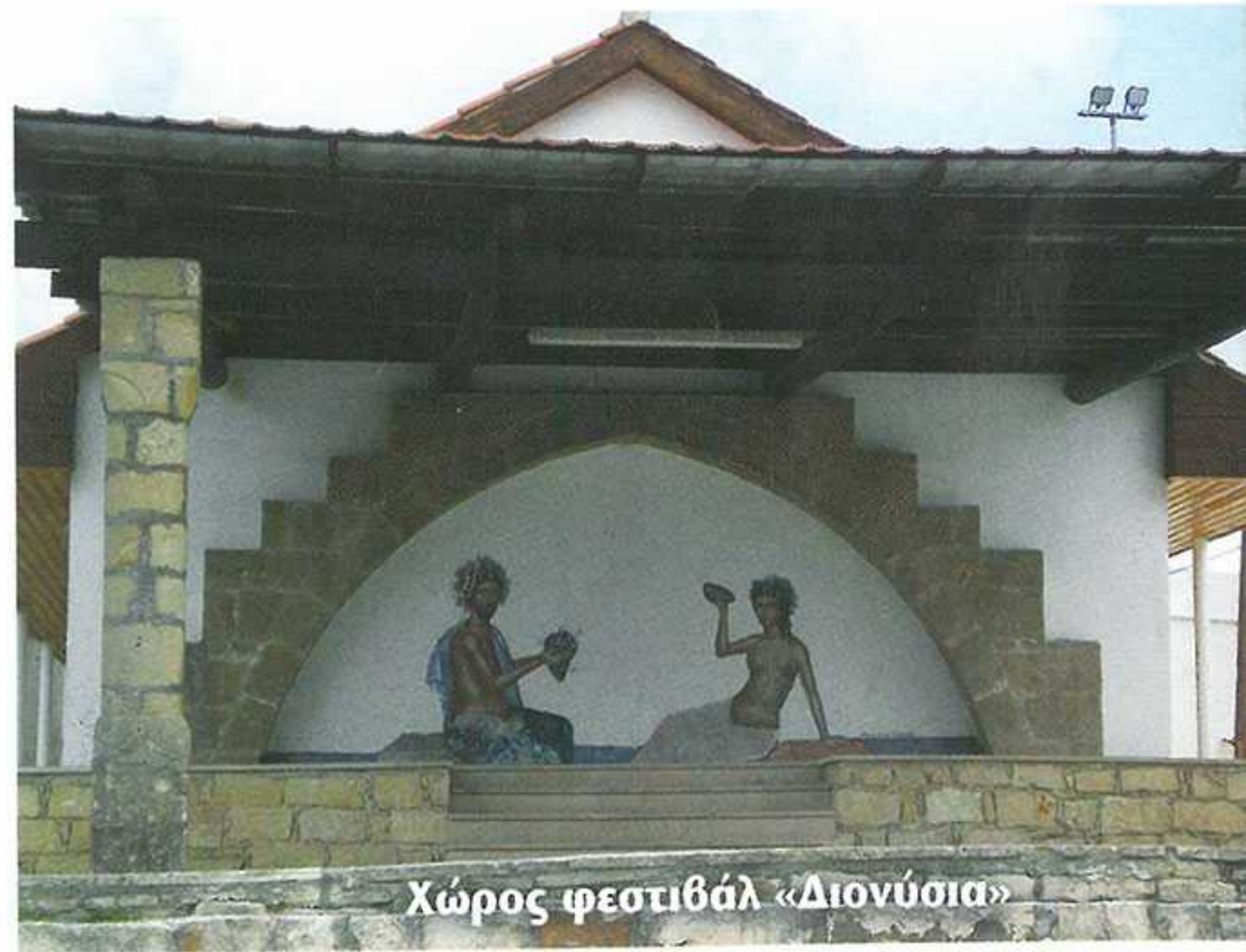
Χώρος φεστιβάλ «Διονύσια»