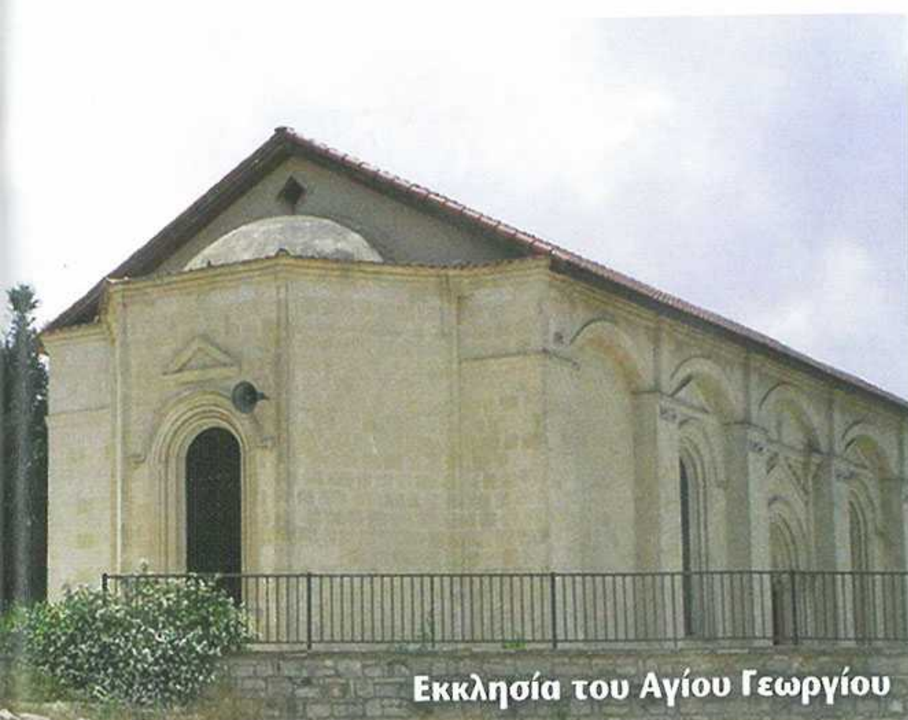
Εκκλησία του Αγίου Γεωργίου

Μια βόλτα στο κέντρο του χωριού θα προσφέρει στον επισκέπτη την ευχαρίστηση της επαφής με την παράδοση. Τα όμορφα σπίτια κτισμένα με πέτρα της περιοχής με