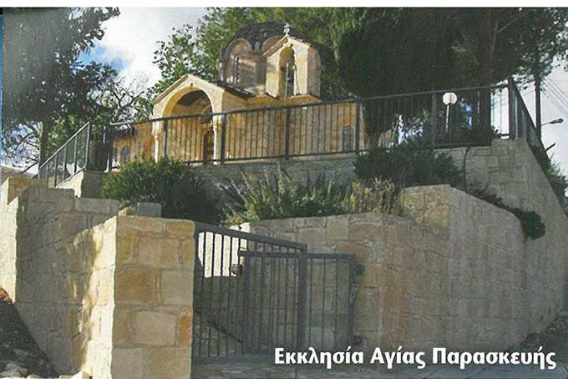
Εκκλησία Αγίας Παρασκευής